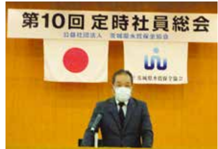
（公社）茨城県水質保全協会 成田理事長

その後、「令和4年度 事業計画及び収支予算」について報告し、すべて了承されました。