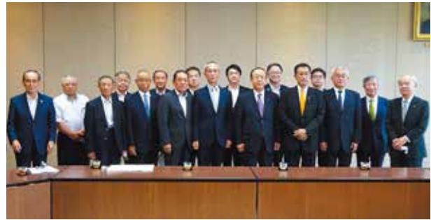
写真中央 常井県議会議長