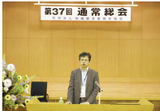
来賓祝辞 大部環境対策課長

その後、平成23年度の事業計画及び収支予算など6議案を審議し、すべての議案について承認されました。