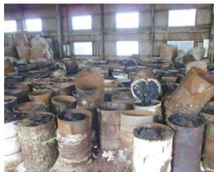
不法投棄された硫酸ピッチドラム缶

産物の被害など、生活環境に重大な支障が生ずる恐れがあり早期の撤去が求められているが、投棄者不明等により撤去が進まないケースもあるため、基金を活用して平成23年度末までに2,519本の硫酸ピッチドラム缶を撤去・処理する予定であり、まだ残っているものについてこの寄附金を有効に活用させて頂きたい。」とのお言葉がありました。