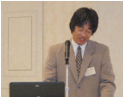
(公社)茨城県水質保全協会 余水検査管理室長

今回のテーマの一つとして、旧式のコンパクト型浄化槽の指摘や改善方法について各検査機関の対応状況について情報交換を行いました。コンパクト型浄化槽が設置され始めた当時から、その構造や仕組みの複雑さゆえに、法定検査の実施においても各検査機関とも様々な悩みを持っているようです。法定検査での悩みは保守点検や清掃においても同様であることが多く、管理作業の難度が上がれば、おのずと適正を欠く施設が増えることとなります。