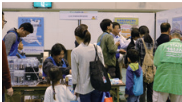
グリーンフェスティバル2017