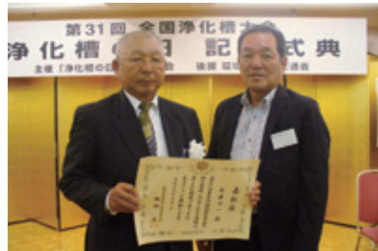
環境省環境再生・資源循環局長表彰を受賞した繁藤副理事長（左）と成田理事長