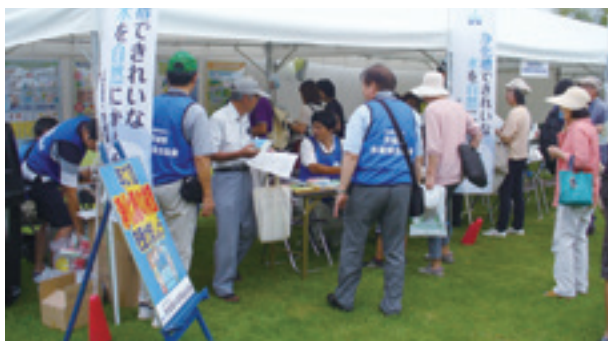
霞ヶ浦環境科学センター 夏まつり2017

8月26日(土)に霞ヶ浦環境科学センター夏まつり2017、10月22日(日)にグリーンフェスティバル2017に参加し、水環境に関する浄化槽クイズ等を実施し、多くの来場者にPR活動を行いました。