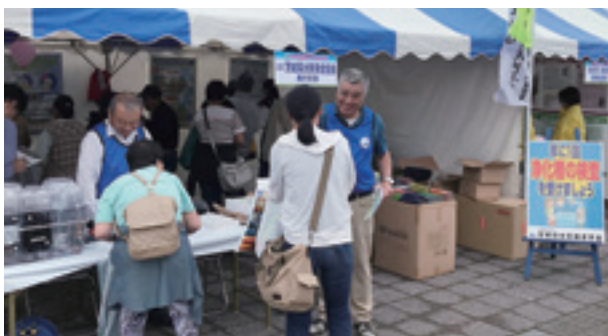
銚田うまっぺフェスタ'17