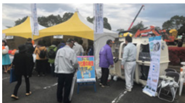
第4回行方ふれあいまつり