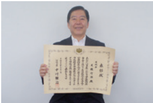
環境大臣表彰を受賞した犬塚副理事長