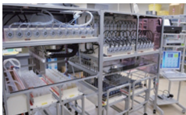
自動定量希釈DO測定装置