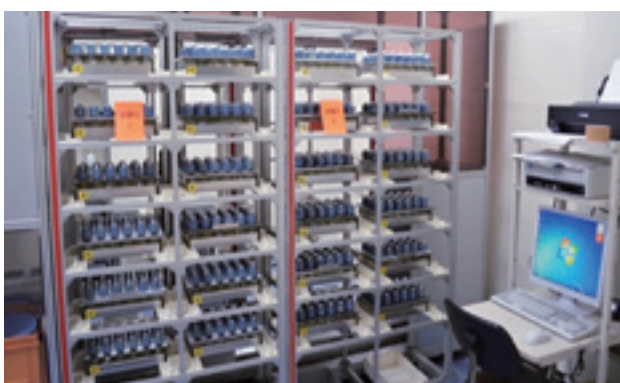
休日対応型自動DO測定装置

又、従来は手動希釈でしたが、自動希釈が出来るようになったことで、作業の省力化が図られ、効率良く分析が行えるようになりました。