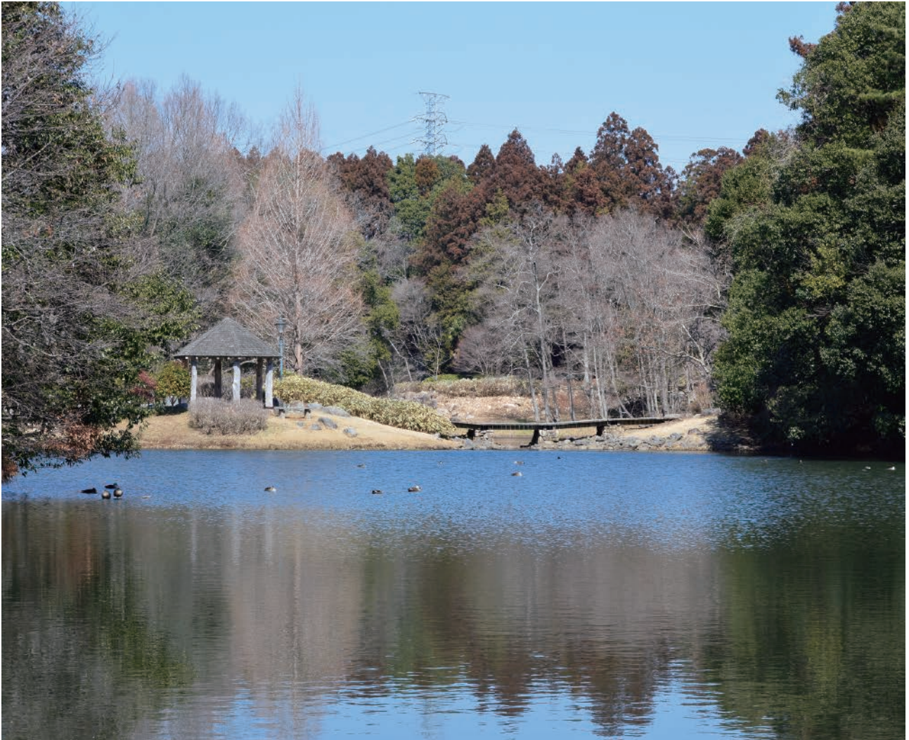
写真／七ッ洞公園（水戸市）